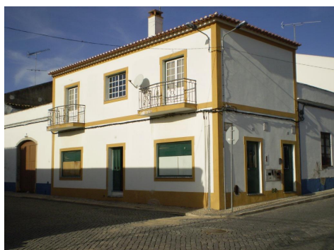
Rua do Carmo cruzamento c/a R. Serpa Pinto

ID 23 Nome Rua do Carmo - troço Fotos nº 647, 651, 647, 656.