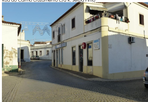
Rua do Carmo cruzamento c/a R. Serpa Pinto