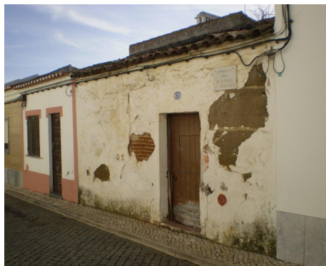
Rua do Carmo, vistas diversas