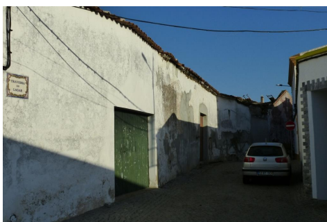
Travessa do Lagar – vista da Rua 1º de Dezembro