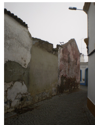
Trav. do Lagar