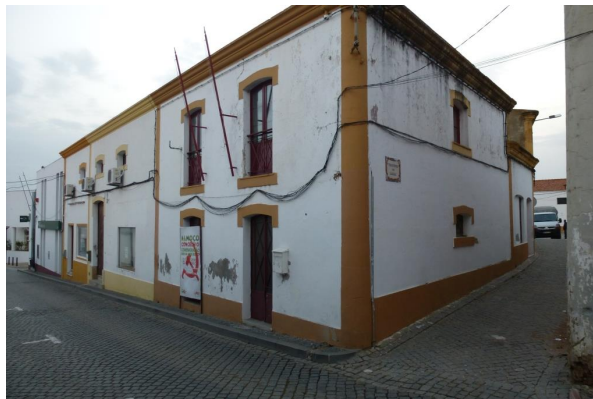
Travessa do Lagar – vista da Rua Serpa Pinto