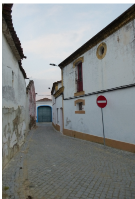
Travessa do Lagar