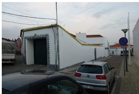
Rua 1º de Dezembro – cruzamento c/Travessa do Lagar