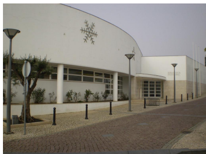
Rua 1º de Dezembro – vista da Rua Serpa Pinto