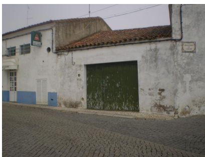
R. da Soc. Filarmónica na continuidade da R. 1º de Dezembro