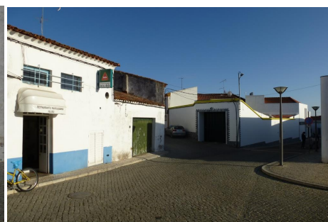
Rua 1º de Dezembro/Rua da Soc. Filarmónica - cruz. Trav. do Lagar