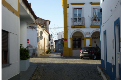
Rua Álvaro Castelões – vista da Rua do Penedo e cruz. c/R. Serpa Pinto