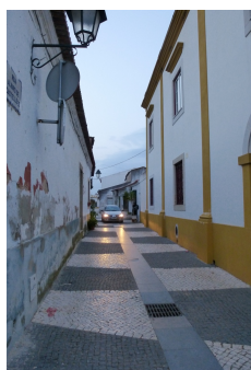
Rua Álvaro Castelões