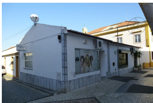
Rua Álvaro Castelões – vista com trav. ao Largo do Almeida