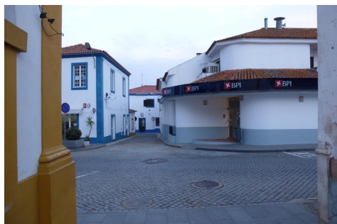
Rua Álvaro Castelões – vista sobre a R. Serpa Pinto e cont. R. do Penedo