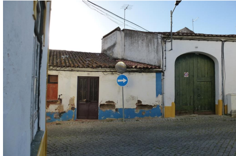
Rua de Beja – vista da Rua do Penedo (topo sul da Rua do Penedo)