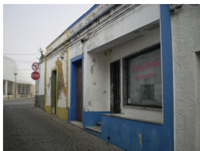
Rua de Beja – vista para a Rua Serpa Pinto