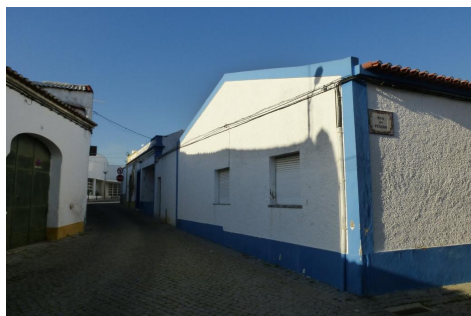
Rua de Beja – vista da Rua do Penedo sobre a Rua Serpa Pinto

ID 19 Nome Rua de Beja - troço Fotos nº 487, 488, 529