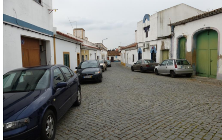
Rua do Penedo – vista sul do "largo"