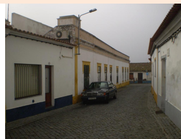
Rua do Penedo – vista sul, sobre a Rua de Beja