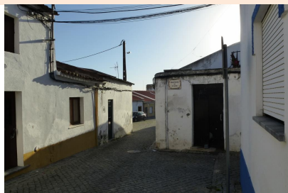
Rua do Penedo – vista sul, cruz. c/ Trav. do Clube