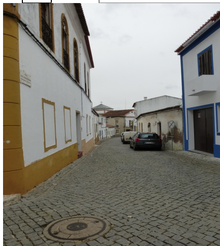
Rua do Penedo – cruzamento com Rua M. Barahona

ID 18 Nome Rua do Penedo Fotos nº 017, 018, 461, 483, 522