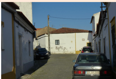
Rua do Penedo – vista norte, cruz. c/ Trav. da Palmeira