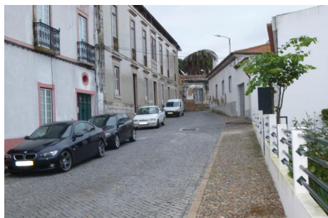
Rua Manuel B. Barahona – Vista do Largo da República