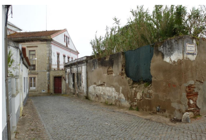
Rua Manuel B. Barahona – Cruzamentoc/Trav. da Palmeira