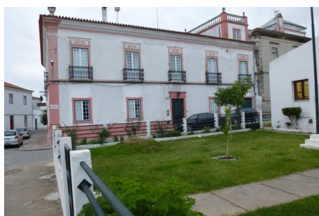
Rua Manuel B. Barahona – Vista do Largo da República