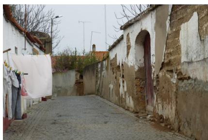
Rua Manuel B. Barahona

• Sinalética → (Viária) Vertical - ■, Horizontal -■, Confusa -□, Estado de Conservação -□, (deficiente) Painéis de inf. /Publicidade → -□