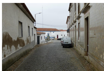
Rua Manuel B. Barahona – Vista sobre o Largo da República