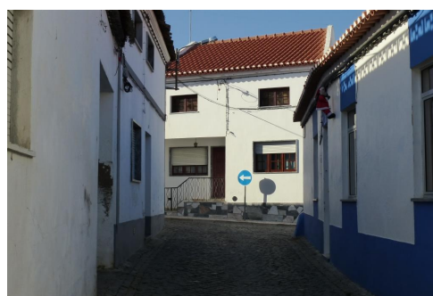
Rua do Touril – vista sobre a Rua da Amoreira