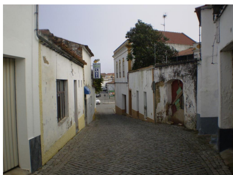
Rua do Touril – vista sobre o Largo da República