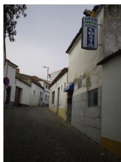
Rua do Touril – vista poente