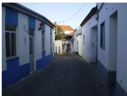
Rua do Touril – vista nascente