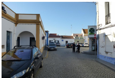
Rua do Paço – vista do Largo