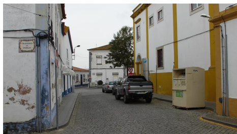
Rua do Paço – vista do Largo do Almeida