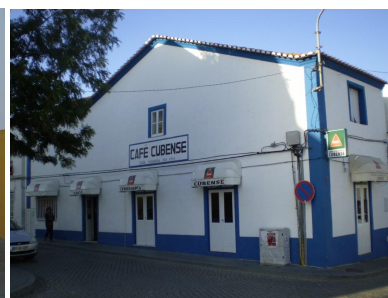
Edifício de gaveto – Rua do Paço / Ruas Serpa Pinto