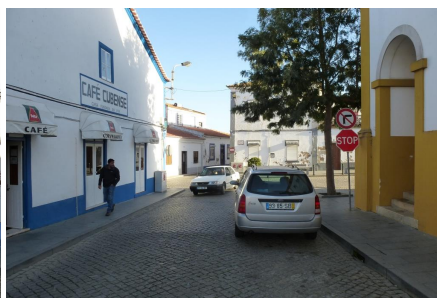
Rua do Paço – vista do Largo do Almeida