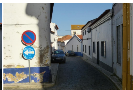
Rua da Amoreira (vista da Rua da Paço)