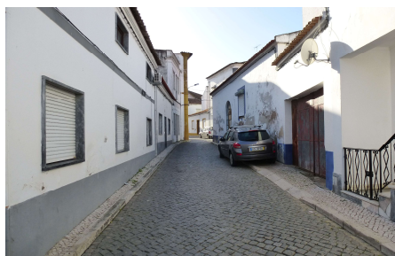
Rua da Amoreira (vista norte)