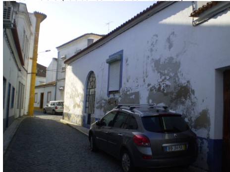
Rua da Amoreira