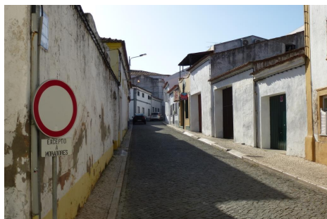
Rua da Amoreira (vista da Rua Dr. Manuel M. da Costa)