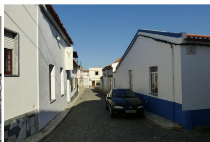
Rua da Amoreira (vista sul) cruzamento c/Rua do Touril