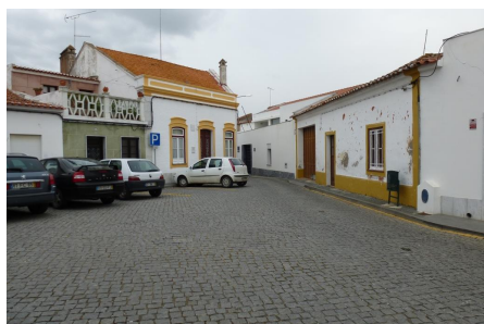
Largo do Almeida (vista sobre a Rua João Vaz)