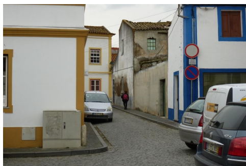
Largo do Almeida (vista sobre a via de ligação à R. Álvaro Castelões)