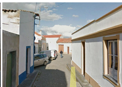
Via de ligação-R.Álvaro Castelões(vista sobre o) Largo do Almeida