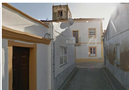
Via de ligação-Largo do Almeida(vista sobre a)R.Álvaro Castelões