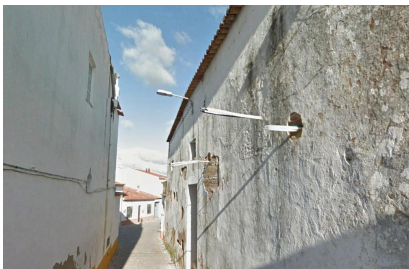
Rua da Parreira