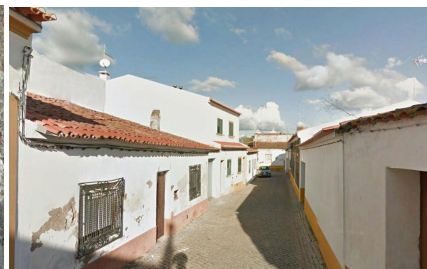
Rua da Parreira (vista sobre cruzamento c/ Rua Dr. Almeida Tojeira)