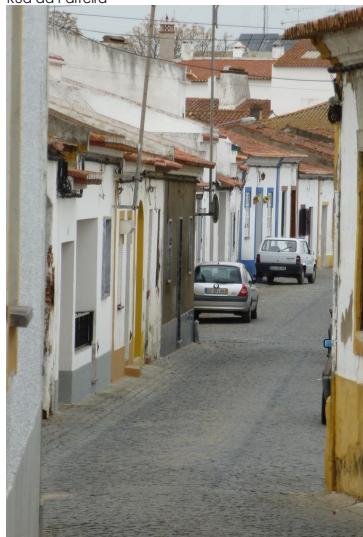
Rua da Parreira (alargamento pontual)