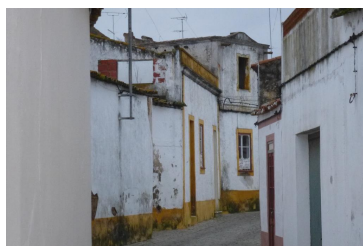
Rua da Parreira