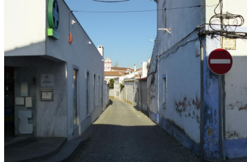
Travessa da Igreja (vista do Largo do Almeida)