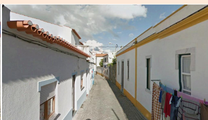
Travessa da Igreja