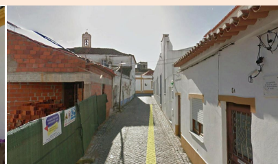
Travessa da Igreja (vista sul)