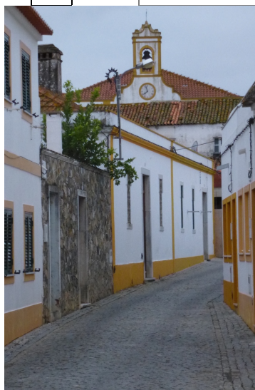
Trav. da Igreja (vista da Rua Dr. João Almeida Tojeiro)

ID 11 Nome Travessa da Igreja Fotos nº 434, 474, restantes fonte: Google