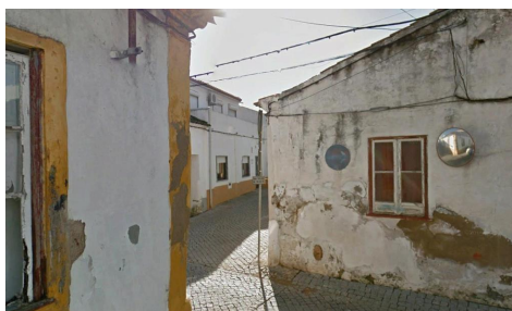
Rua João Vaz (vista Sul) – Cruzamento c/ Ruada Am oreira