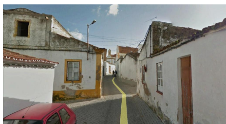
Rua João Vaz – cruzamento com Rua da Parreira