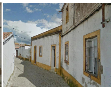
Rua João Vaz