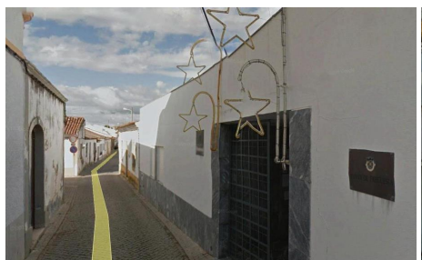
Rua João Vaz - gaveto (vista Norte)