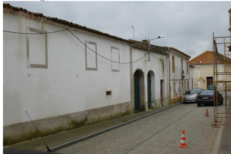
Rua da Longa