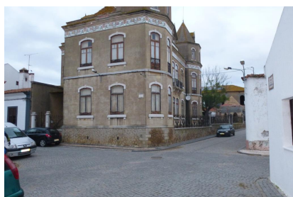
Cruzam. R. da Longa/R. da Parreira/ R.Dr. J. de Almeida Tojeiro Rua da Longa