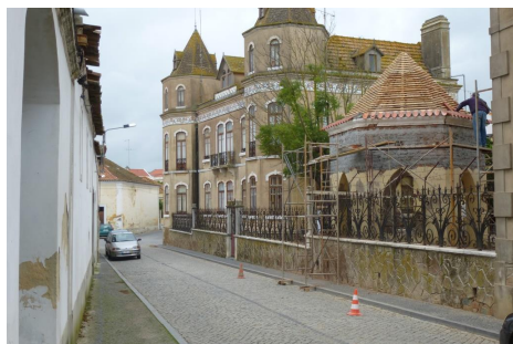
Rua da Longa