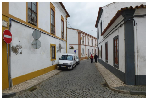
Rua Dr. João Almeida Tojeiro – Vista da Rua da Rua – Serpa Pinto

ID 8 Nome Rua Dr. João Almeida Tojeiro Fotos nº 432, 433, 435, 922, 940