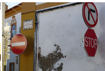
Rua Dr. João Almeida Tojeiro – Cruzamento c/ Ruada