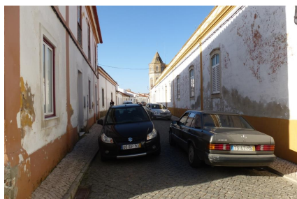
Rua Dr. João Almeida Tojeiro