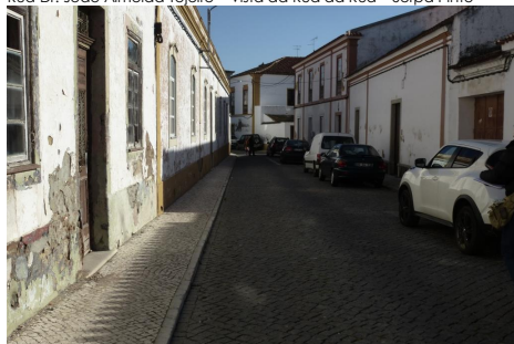
Rua Dr. João Almeida Tojeiro