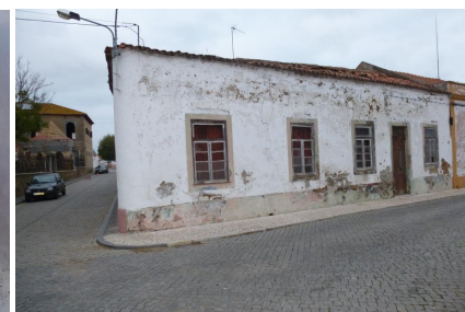
Rua Dr. João Almeida Tojeiro – Cruzamento c/ Ruada