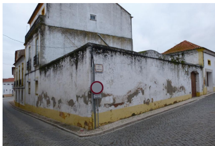
Rua Dr. Manuel M. da Costa – Cruzamento c/ Ruada Amoreira