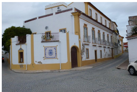
Rua Dr. Manuel M. da Costa – Vista da Rua Praça da República