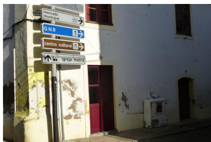
Rua Dr. Manuel M. da Costa – gaveto /Rua Serpa Pinto