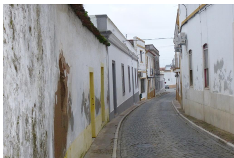
Rua Dr. Manuel M. da Costa