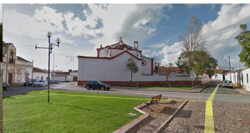
Vista do Largo Conde Ferreira sobre tardoz da Igreja, R. Serpa Pinto/R. da Longa