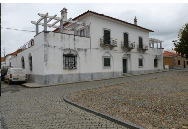
Edifício com interesse, confinante c/ o Largo 5 de Outubro