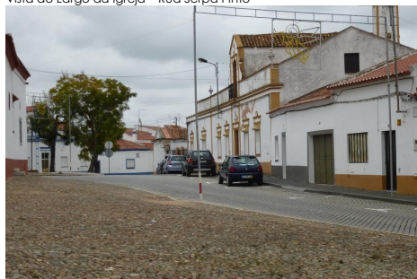
R. Serpa Pinto, traço adjacente à Igreja, vista sobre o L. Conde Ferreira