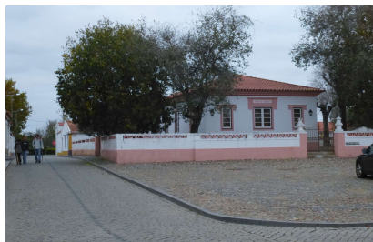
Equipamento adjacente à Igreja (Largo 5 de Outubro)