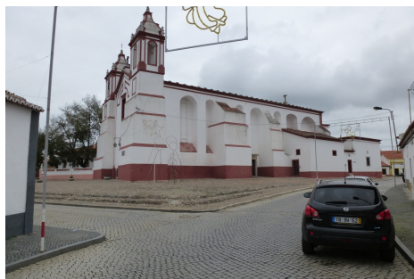
Vista do Largo da Igreja – Rua Serpa Pinto