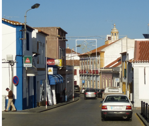
Rua Serpa Pinto – Vista Norte