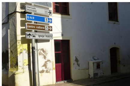
Rua Serpa Pinto cruz. c/ R. Dr. Manuel M. da Costa