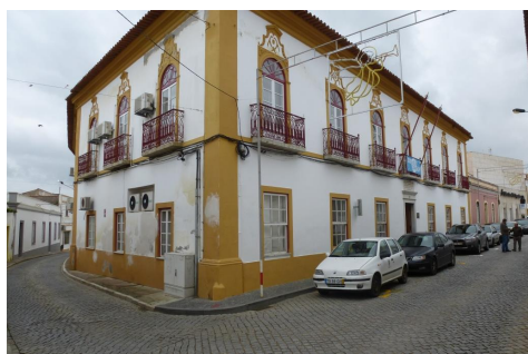
R. Serpa Pinto cruz. c/ R. Dr. Manuel M. da Costa – Edifício C. M. de Cuba

ID 5 Nome Rua Serpa Pinto (troço Largo Cristóvão Colón – Largo da Igreja Matriz) Fotos nº 435, 436, 465, 923, 926