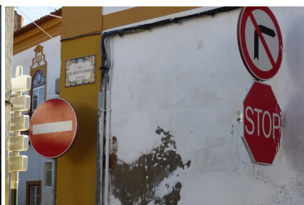
Rua Serpa Pinto cruz. c/R. Dr. João Almeida Tojeiro