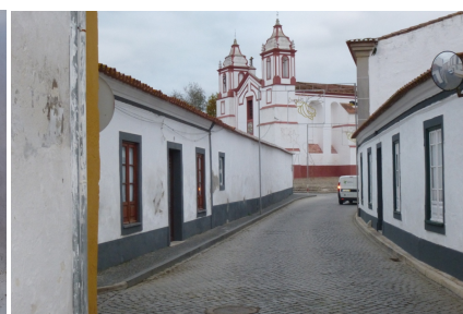
Rua Serpa Pinto, vista sobre o Largo da Igreja Matriz