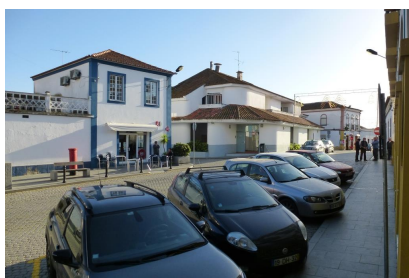
Vista Sul – Estacionamento reservado-Tribunal (478)