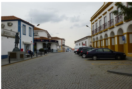
L. Cristóvão Colón – Vista Sul (014)

ID 4 Nome Largo Cristóvão Colón- Largo do Tribunal (Rua Serpa Pinto) Fotos nº 014, 028, 463, 464, 478