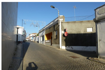
Vista Norte – cruzamento c/Travessa do Jasmim