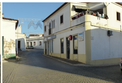
Vista Norte – cruzamento c/Rua do Carmo