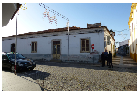
R. Serpa Pinto-L. Cristóvão Cólon – Cruzamento c/R. Álvaro Castelões

ID 3 Nome Rua Serpa Pinto (troço Rua do Carmo / Largo Cristóvão Cólon- Largo do Tribunal) Fotos nº 027, 466, 493, 494, 497