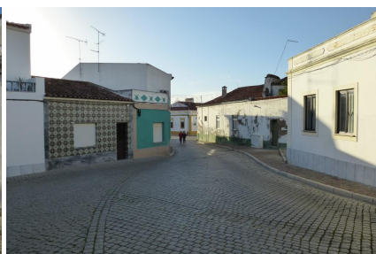
Vista Sul – Cruzamento c/ Rua Xavier Vieira