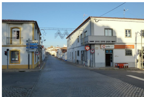
Rua Serpa Pinto – Vista (Norte) da Rua 1º de Maio

ID 2 Nome Rua Serpa Pinto (troço Jardim dos Combatentes da Grande Guerra / Rua do Carmo) Fotos nº 914, 497, 501, 502, 510