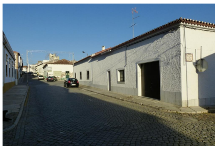
Vista Norte – cruzamento com Travessa do Carmo