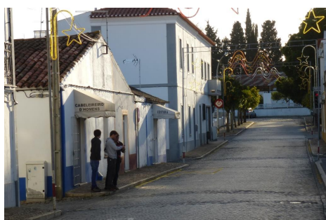
R. Serpa Pinto-Vista (Sul) prolongamento Jardim dos C. Grande Guerra