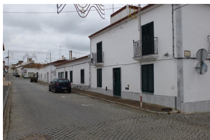
Vista Norte – cruzamento c/Rua Augusta