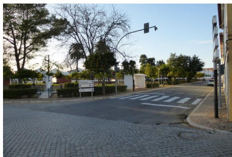
Árvores em alinhamento – Jardim